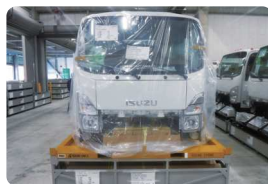
キャブ用容器（オレンジ） 部品用容器（グレー）

海外の組み立て工場へ自動車の部品やキャブ（運転席のこと）を輸出する時に「リターナブル容器」を使っています。リターナブルとは、再使用するために返却・回収ができるという意味です。今までは海外工場で容器を捨てていましたが、限りある資源を守るため、くり返し使える容器を導入し、日本へ返却後、再び海外に向けて使用しています。また、一つのコンテナにたくさんの容器が無駄なく積めるよう、容器の形や大きさを工夫し、輸出するコンテナの数も削減しています。